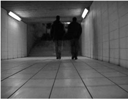
Contagion – Video installation / Marcelino Botín Award 05