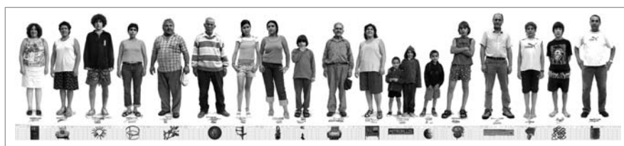
6mm3-The Darkroom – Video installation / Marcelino Botín Award / 2005

durante decenios por una compañía americana. O como lo hizo igualmente en "6mm3-The Darkroom" (El cuarto oscuro), donde quienes hablaban eran los habitantes de Villa Potrerillos, un poblado andino, situado en la provincia de Mendoza, en Argentina, que fue anegado por seis millones cúbicos de agua, debido a la construcción de una presa. En estas obras que tomo como ejemplo, la