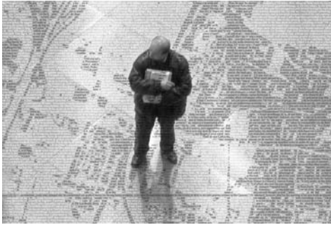
Surveillance, Atocha Station / 2008

world of contemporary art, which finds in the art fair one of the key moments for the legitimization and institutionalization of competition.