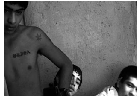
5 Dots – Video / International Film Festival Oberhausen / 2008

guided by the Michel Foucault's words included in one of his writings: "the knowledge that the dominant culture does not need for itself is the only one that is not assimilated by power, which is the only one that shall not be assimilated as a weapon of repression". This is the "knowledge" that Ochoa has sought for in the memory of the SAD.CO old miners, and in the reconstruction of the old photographer Pedro Vidart figure through the accounts about his life and death made by the dwellers of the Potrerillos Villa. The knowledge of some defeated who are not convinced, and which is, consequently, discrete, disseminated, singular, always singular and hardly assimilable to the omni comprehensive vocation, homogeneity, continuity and fluency, both logical, historical, and temporal, of the dominating discourses.