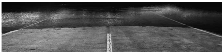
6mm3-The Darkroom – Video installation / Marcelino Botín Award / 2005

company, made their voices heard. Or as he portrayed in "6mm3-The Darkroom", whose narrators were the residents of Villa Potrerillos, an Andean town situated in the province of Mendoza, in Argentina, flooded by six million cubic liters of water for the building of a dam. In these works that I take as an example, the purpose of impugment was to evidence the strategies and mechanisms that favor the silencing and the invisibility of the discourses and practices of the subordinates. To silence is, nonetheless, an insufficient qualification when it becomes apparent that the dominating discourses and the discourse mechanisms that make them possible, do not simply ask for silence. They display their efficacy by reinterpreting the