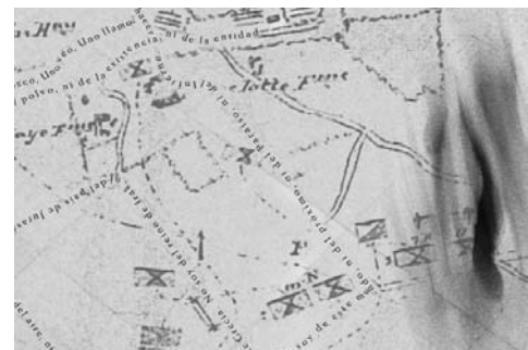
Cartography, Atocha Station / 2008

Y que es la que se convierte en el asunto principal de la serie "Multitudes", que Ochoa emprende después y que tiene su primera concreción en las obras centradas en la edición de 2006 de Art Basel. Los sujetos de estos cuadros, pintados con una gama que va de los grises a los negros, son los sujetos de una multitud muy singular que es la de artistas, aficionados, coleccionistas, curadores, críticos de arte, directores de museos, colecciones y publicaciones especializadas, periodistas y simples curiosos, venidos desde todos los rincones del planeta con el fin de participar en la que es la feria de arte más prestigiosa del mundo. Y cuya actuación,