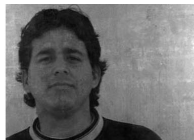
La Casa Ideal / video / 2008

sin ser visto para aislar en la multitud siempre apresurada, siempre cambiante, los cuerpos, los rostros, los gestos mediante los cuales cada quién da curso, en cada momento, a la singularidad. Hay, además, un aspecto de estos cuadros que tiene una importancia crucial. Me refiero a que en ellos están impresos sobre el pavimento de los vestíbulos y los corredores de la estación, mapas o planos de ciudades que no se consigue sin embargo identificar. Aunque el término “impreso” no resulta aquí del todo apropiado porque esos mapas está dibujados mediante una asombrosa matización en gris del texto íntegro de “El