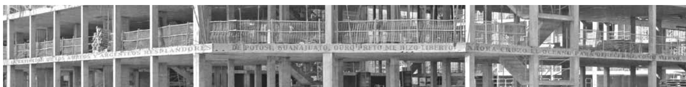
Mirage at development, Parla Madrid / 2008

Él propone otra modalidad de encuentros entre el Primero y el Tercer mundo en la serie "La Casa Ideal", que tiene como propósito someter la arqueología a una torsión temporal, capaz de convertirla en una arqueología en tiempo futuro que retenga y documente aquello que hoy mismo nos resulta tan invisible como el cuerpo efectivo los pueblos, las civilizaciones y las culturas irremediamente destruidos. A esa serie pertenecen las obras agrupadas en "La Casa Ideal" que contrapone imágenes de edificios en construcción durante el impresionante boom inmobiliario que viene de concluir, con los rostros y los testimonios de quienes vinieron desde los Andes a inflar con su duro trabajo esa burbuja especulativa. Dichos testimonios giran en torno a las imágenes forjadas por el deseo de esos trabajadores de tener su propia casa, que, por singulares, resultan muy distintas del modelo o, si se quiere, del delirio racionalista a lo Ludwig Hillberseimer, representado por el esqueleto portante de los grandes bloques de vivienda ofrecidos por los promotores inmobiliarios a las actuales multitudes urbanas.