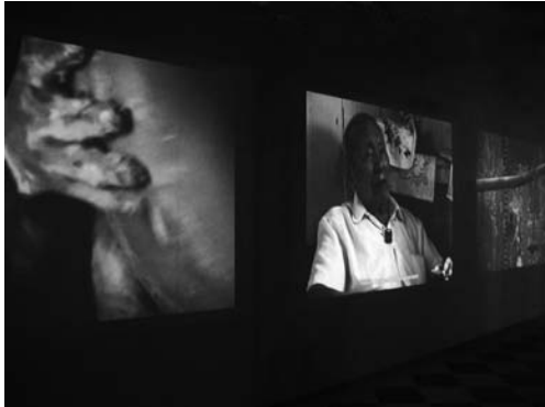
Sad.Co - The Blind Castle – Video installation / Venice Biennale / 2003